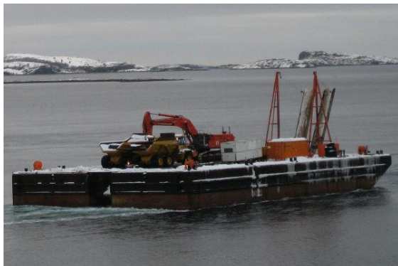
Bildet over viser "Breistein" under slep med maskiner til Bessaker.