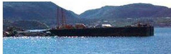
"Breistein" ved steinfylling i Kristiansund, utbygging Vestbase.