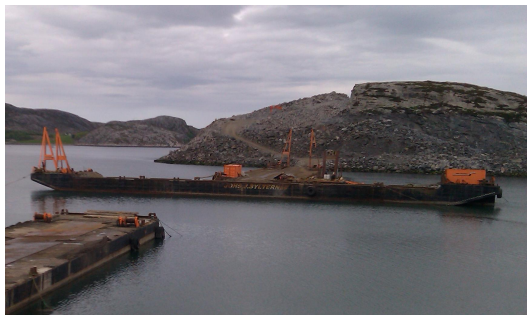
Bildet over viser "Storstein" i posisjon mellom Løaholmen og Bessaker sommeren 2010.